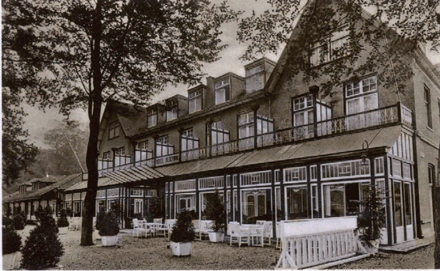
APELDOORN, HOTEL BLOEMINK