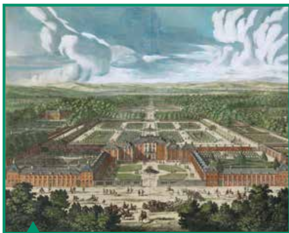
Vogelvlucht Paleis Het Loo, Pieter Schenk, circa 1700 (collectie Paleis Het Loo)

De tuinen bestonden uiteindelijk uit een lager gelegen 'Beneden-tuin' direct achter het paleis, twee privétuinen voor Willem en Mary aan weerskanten van het paleis en een meer naar het noorden gelegen 'Boventuin'. Het geheel werd omgeven door verscheidene 'tuinkamers', met onder andere een labyrint en boomgaarden.