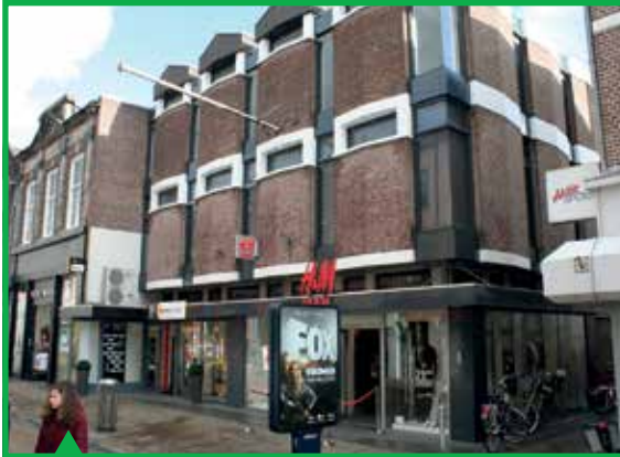
Winkelpand, Hoofdstraat 80/83

De herbergzame binnenstad gaat over de gezelligheid van wonen in of bij het centrum in gebouwen die zijn gerealiseerd op de plekken die eind jaren '60 in en om de binnenstad waren gesloopt.