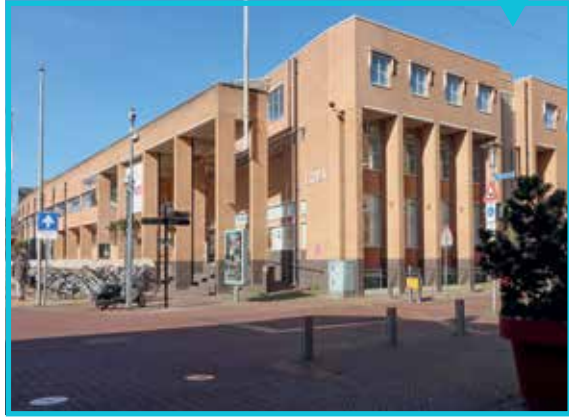
Bibliotheek, Vosselmanstraat 299

In Het verleidelijke stadsbeeld zijn bijzondere en iconische panden opgenomen, die herkenbaar zijn en specifiek het beeld van Apeldoorn bepalen.