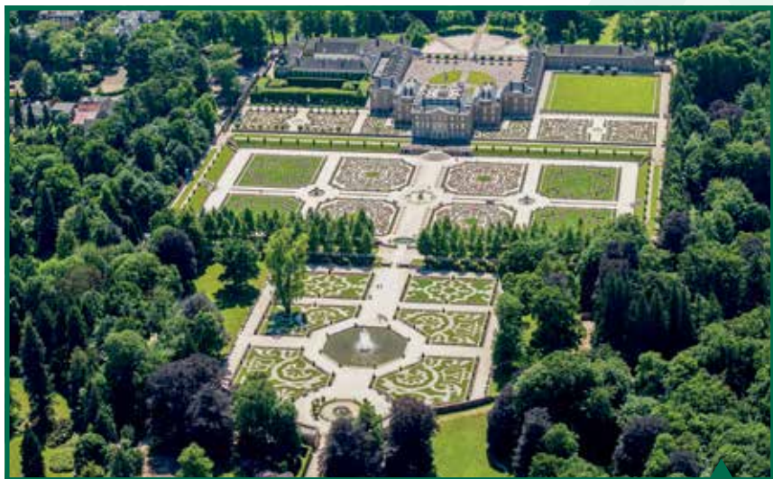
Luchtfoto na herziening tuin.

historisch onderzoek was het mogelijk om meer correcte detailleringen op te nemen. Een voorbeeld hiervan is het inzicht dat in de Benedentuin bloemenranden waren samen met gras, in plaats van het gebruikte rood steenslag. In plaats van cement werd er nu blauw Belgisch hardsteen gebruikt als basis voor de Venus- en Hercules fontein én de afmetingen van de haagjes werden aangepast. In de 17e eeuw was een haagje namelijk bedoeld als een randbeplanting, om het grind van de paden uit de bloemenranden van de parterres te houden. Hieruit volgde de keuze om de haagjes langs de randen laag en smal te houden.