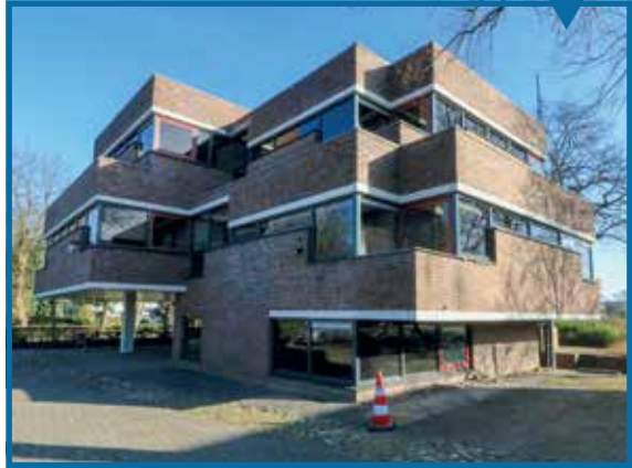
Christiaan Geurtsweg 3

In het thema De zakelijke city zijn vooral kantoren en bedrijfspanden opgenomen verspreid over het stedelijk gebied, zowel in het centrum als de bedrijfsterreinen.