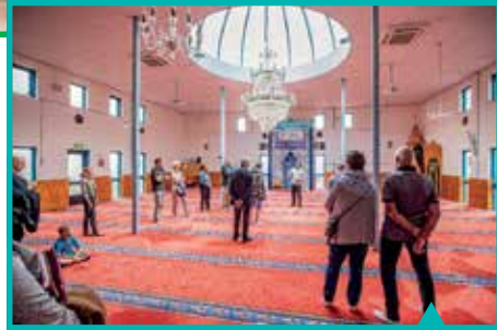
Eyüp Sultan Moskee

Zowel in de synagoge als ook in de moskee kregen bezoekers uitleg over tradities en gebruiken. Honderden bezoekers wandelden de speciaal uitgezette (verkorte) route langs de historische graven op de Rijksmonumentale begraafplaats aan de Soerenseweg. Wat een cultuurhistorische en maatschappelijke rijkdom, op zo'n korte afstand van elkaar.