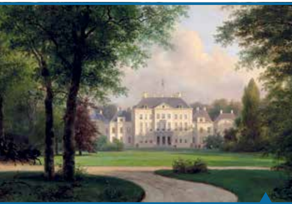
Het Witte Loo in een landschapspark, Andreas Schelfhout, 1838 (collectie Paleis Het Loo)

groepen ontstaat er een groot contrast met de eerdere symmetrie van de barokke tuin.