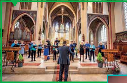
OLV kerk met optreden van de Veluwe Cantorij