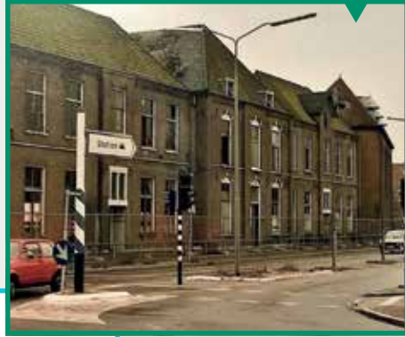
Katholieke meisjesschool bij de Mariakerk

Directe aanleiding was dat de Katholieke Meisjesschool aan de Molenstraat plaats moest maken voor een minder fraai, woningencomplex: eeuwig zonde die sloop in 1986 van deze monumentale school bij de Mariakerk (de huidige Onze Lieve Vrouwekerk).