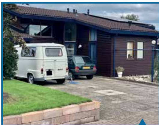
Nordic-woningen, Maria Stuartstraat 39

Ten slotte wordt Het Veluwe gevoel weerspiegeld in een groot aantal verschillende woningtypen, bijzondere woonvormen en gebouwen, waaronder ook in een aantal dorpen.