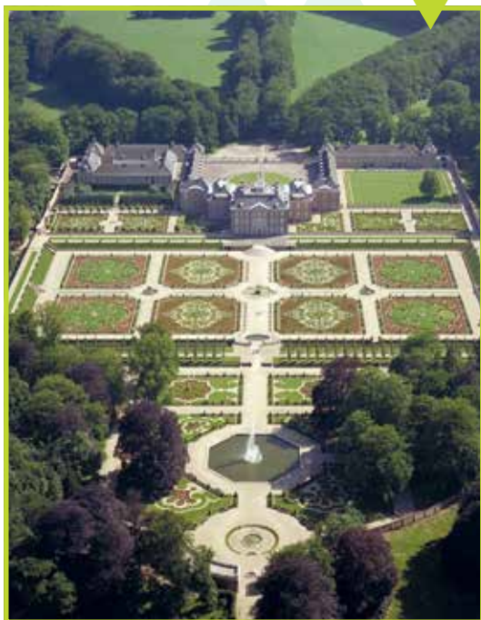
Luchtfoto na opening als museum. Foto Holland, 1987 (collectie Paleis Het Loo)

Koningin Wilhelmina (1880-1962) was opgegroeid op Paleis Het Loo en deze omgeving was haar 'favoriete plekje op aarde'. Ze heeft veel tijd doorgebracht in het landschappelijke park en de omliggende bossen van de Veluwe. Na haar dood werd besloten om het paleis tot nationaal museum om te vormen en terug te brengen naar de originele 17e-eeuwse vormgeving. Daarvoor werd het paleis van een witte pleisterlaag ontdaan, werd er een extra verdieping verwijderd en werd een in het begin van de 20ste eeuw aangebouwde balzaal gesloopt. Een klein deel van het grondgebied, direct achter het paleis, werd teruggebracht naar de 17e-eeuwse barokke tuin.