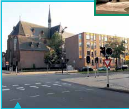
Huidig woningcomplex op de plaats waar de meisjesschool stond

SAM gaat in 2022 aandacht besteden aan haar 35-jarig bestaan. In 2017, ter gelegenheid van ons 30-jarig bestaan, vierden we dit met een SAM Adoptieproject: Het terugbrengen van de Philipsreclame op de muur van het pand hoek Hoofdstraat/ Kapelstraat. Meer hierover is te vinden op de SAM website. Ook werd het (eerste) jaarboek: 'SAM-Kroniek Lustrum nummer' uitgebracht, deze is nog altijd te downloaden op www.apeldoornsemonumenten.nl/publicaties/