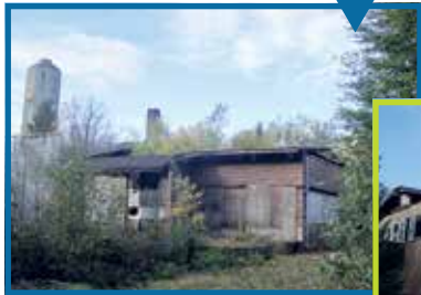
Het afgebrande hotel

Radio Kootwijk, het imposante radiozendstation midden op de Veluwe, aan de rand van de gemeente Apeldoorn, spreekt tot de verbeelding van talloze mensen. Het is dan ook geen toeval dat dit Rijksmonument elk jaar opnieuw met gemak 3.500 bezoekers trekt tijdens de Open Monumentendagen.