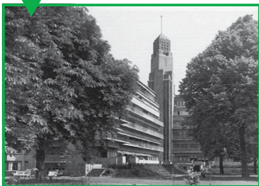
De Willemspark-flat in Den Haag