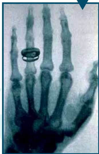
Hand met ring

Want laten we wel wezen, het is toch waarlijk wel gepast dat er in Apeldoorn iets te zien en beleven valt over de man die met zijn ontdekking zo'n grote invloed op ons dagelijks leven heeft ontketend. Immers, er zijn maar weinig mensen waarvan nog nooit een röntgenfoto is gemaakt. Denk bijvoorbeeld eens aan het scannen van bagage op luchthavens waar ook gebruik wordt gemaakt van röntgenstralen. Zo zijn er nog veel meer toepassingen te noemen van de revolutionaire ontdekking door een in Duitsland