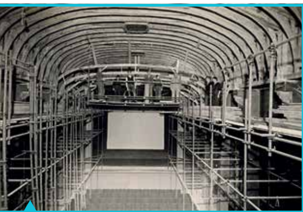
Theaterzaal tijdens de verbouwing in 1942. Naast de oorspronkelijke vorm van het plafond zijn achter het steigerwerk enkele dragers met mensenhoofden te zien

In de periode vanaf de opening in 1918 heeft het gebouw meerdere verbouwingen ondergaan. De meesten daarvan zijn zichtbaar en te dateren, mede aan de hand van het bouwvergunningenarchief. Mogelijk heeft de eerste verbouwing al plaatsgevonden nadat in 1920 de nieuwe eigenaar Boon zich aandeede. Aan het einde van de jaren '20 of begin van de jaren '30 zijn waarschijnlijk de toiletten, die zich aan weerszijden van de entreehal en de bovenhal bevonden, vergroot langs de zijgevels van de theaterzaal. Bijzonder in de toiletten is het tegelwerk met diverse hulpstukken en keramische elementen met afgeronde binnen- en buitenhoeken. In de herenafdeling zijn van deze elementen de manshoge schaamschotten tussen de urinoirs aangebracht.