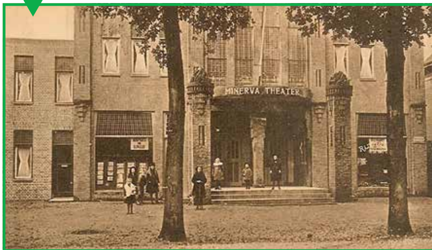
Entree theater rond 1925, geflankeerd door winkels